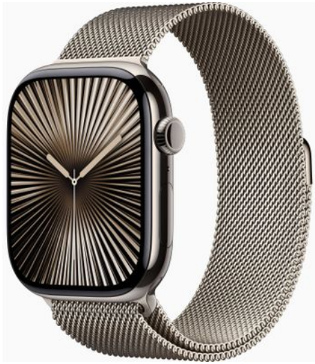
Merk: Apple Model: MWXF3QF/A