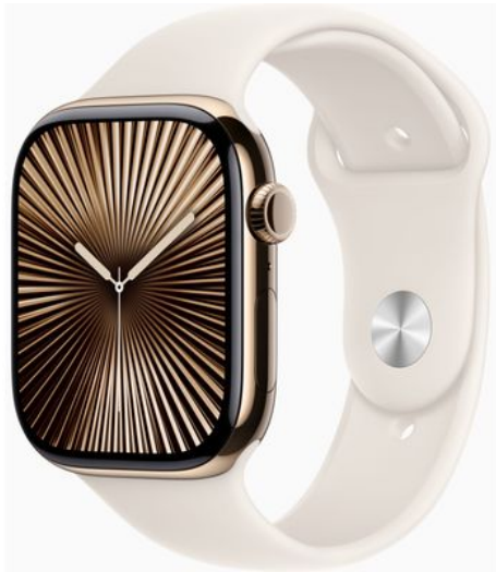
Merk: Apple Model: MWYX3QF/A