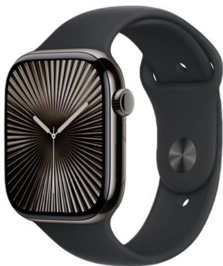
Merk: Apple Model: MWYD3QF/A