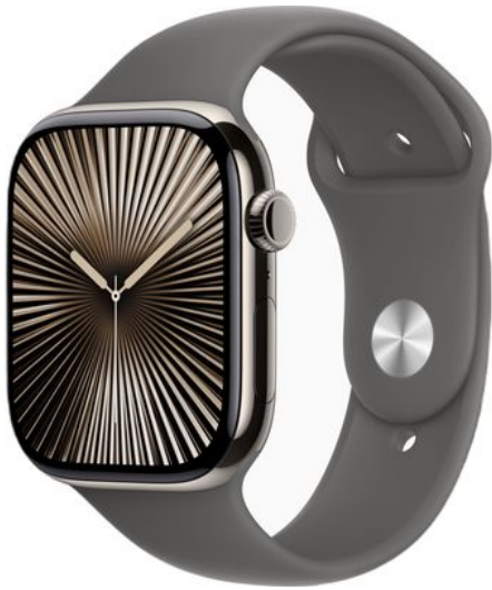
Merk: Apple Model: MWYA3QF/A