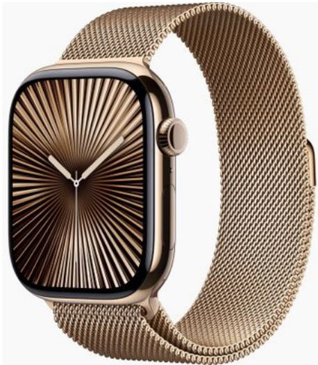
Merk: Apple Model: MX003QF/A