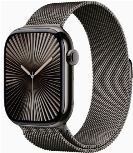
Merk: Apple Model: MC7R4QF/A