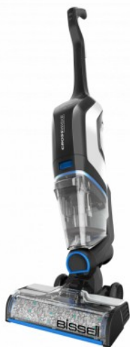
Merk: Bissell Model: B2765N