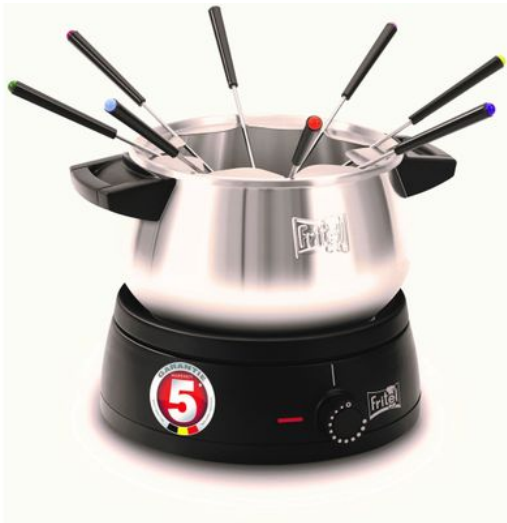
Merk: Fritel Model: 142087